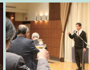
ノンアルコールシャンパンで 乾杯…!