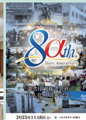
当日パンフレット