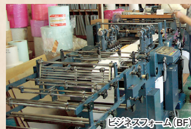
ビジネスフォーム(BF)