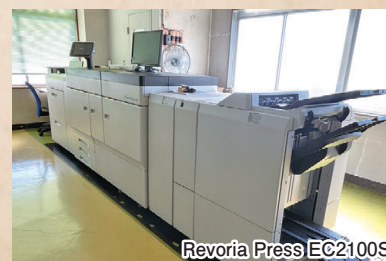
Revoria Press EC2100S