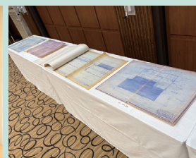
現在の社屋の増改築の見取り図 みんな興味津々でした