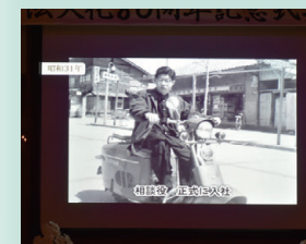
歴史を振り返る動画は、 10分間の大作でした!