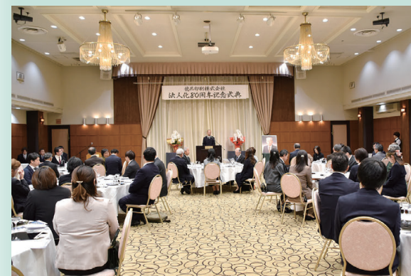
記念式典にふさわしい、厳かな雰囲気の中で開会しました