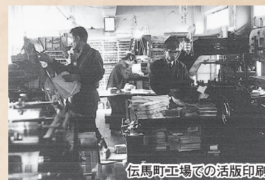
伝馬町工場での活版印刷