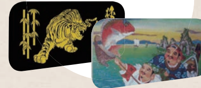
トラック用各種安全窓プレート

各車種対応のトラック用安全窓プレート、 各車アンドン板アルナプレート製作承ります。