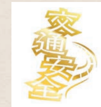
カッティングステッカー