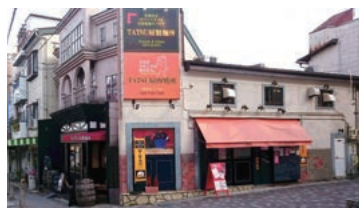
TATSU 屋肉焼所 住所 飯田市中央通り4-10-1 電話 080-7702-7498

そんな現代人のニーズに応える魅力を提供しているのが、馬肉なのです。 じだわりの製麺 Pick Up 当店の馬肉は、刺身でも食べられる厳選した良質の馬肉を、独自のルーツで仕入れて提供しております。飯田ではめずらしいオリジナルの鉄板で、両面を焼いたレアは、お客様にも好評を得ております。めずらしい部位を含めた5種盛りや、馬肉のユッケなど、人気のメニューで楽しんでいただくことをお楽しみください。小さいお店ですが、ご来店の際はご予約をお願いします。 また、当店隣「TATSU屋製麺所」では、イタリアン料理も楽しめます。看板メニューは濃厚ミートソースと、イタリアン・タパスと呼ばれるお酒に合う皿料理。パーティーはもちろん、親しい仲間同士でもお気軽にお越しください。